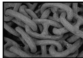
Déblocage des assemblages mécaniques