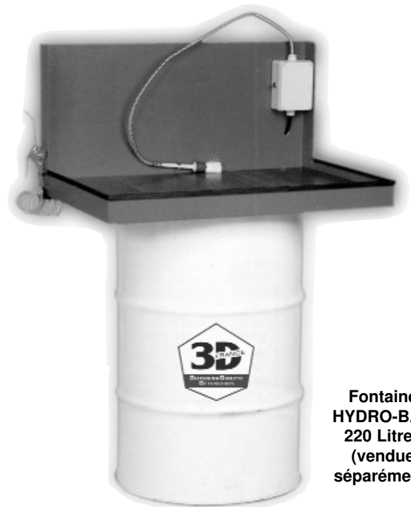
Fontaine HYDRO-BAC 220 Litres (vendue séparément)

Ces renseignements sont purement indicatifs. Toute autre application ne pourrait engager notre responsabilité